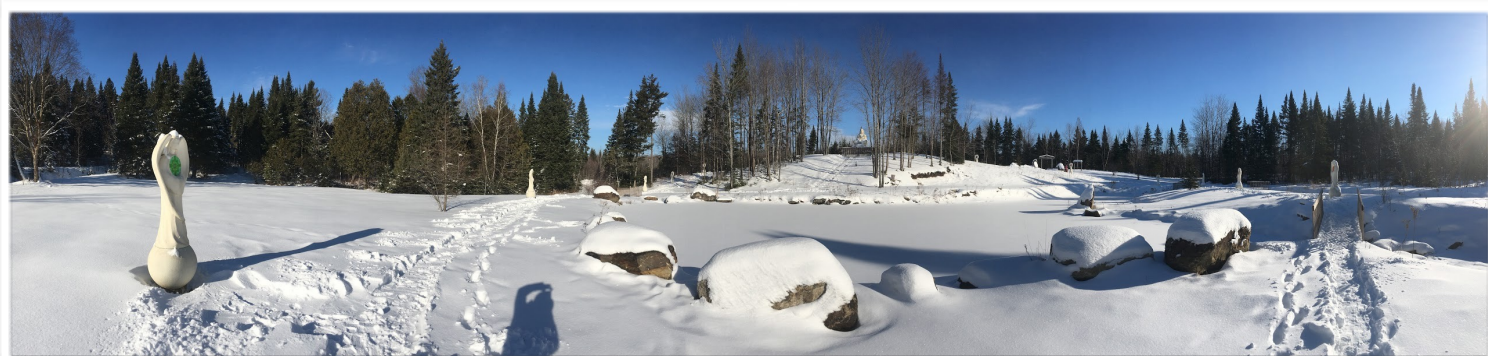
Jardin de l'Archange Gabriel avec les 12 statues du Collier de Gabriel dans le village de Cookshire au Québec.