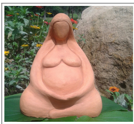
Statue représentant la Mère offerte par les esséniens à Dieu la Mère.

vie. L'homme a beau s'inventer des mondes et une histoire, il n'est rien d'autre que ce qu'il est. C'est pourquoi il est fondamental qu'il apprenne à lire, à déchiffrer ce que peuvent être les arbres, les fleurs, les animaux, la terre, le sable, la lumière, les eaux, les montagnes et tous les êtres qui partagent son environnement et la vie de la terre. C'est dans ce système que l'homme doit trouver sa place et être un créateur d'harmonie et de paix et non un profanateur, un destructeur, un anarchiste. Aujourd'hui, il a décidé qu'il était le roi et pour asseoir sa suprématie, il a détruit l'environnement. Il a voulu montrer qu'il est la seule existence douée d'intelligence, qu'il n'y a aucune opposition à son pouvoir et qu'il n'a de comptes à rendre à personne.