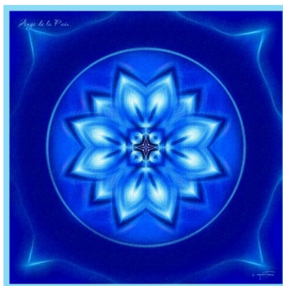
Mandala de l'Ange de la Paix